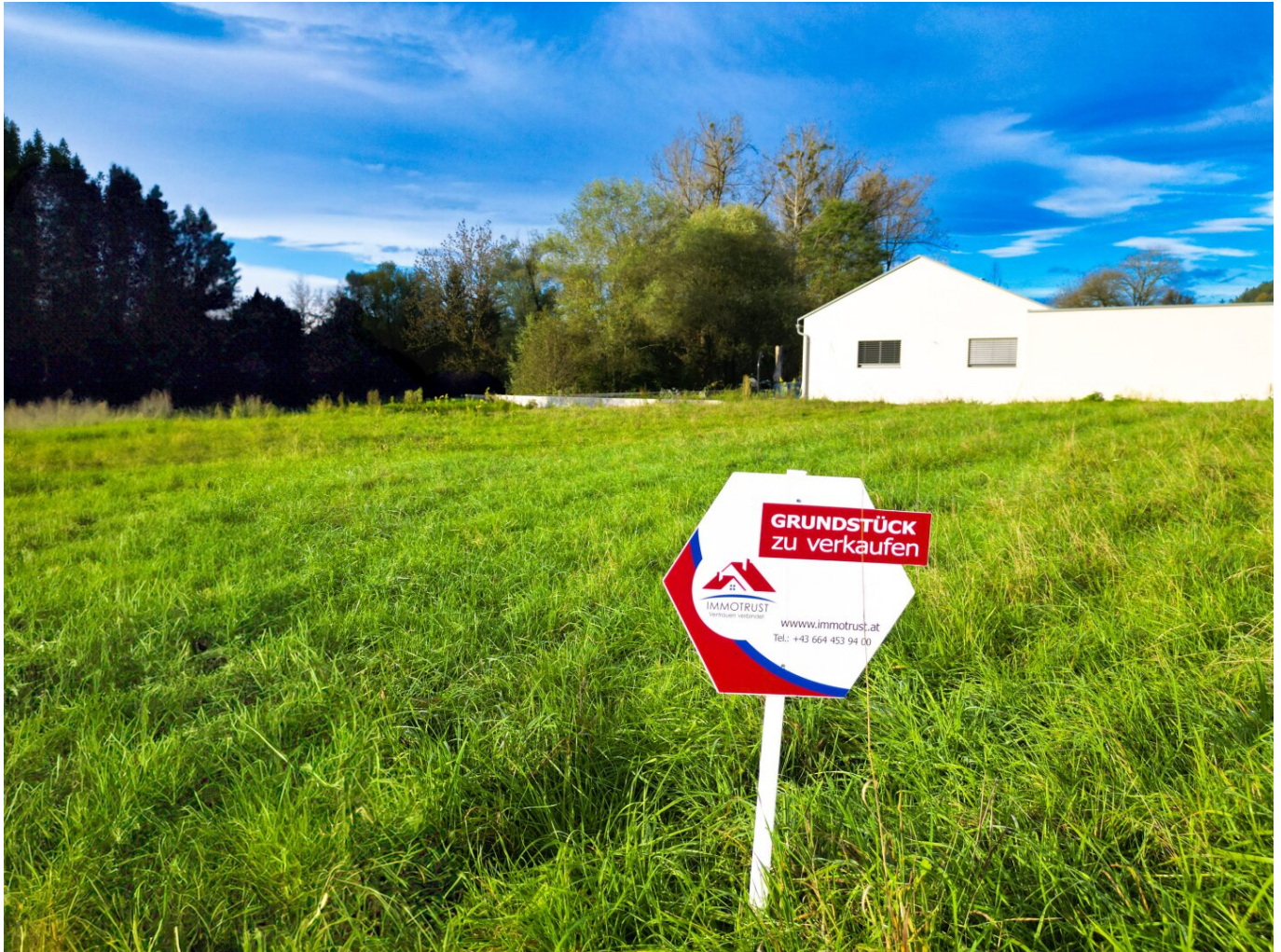
Bild vom Baugrund