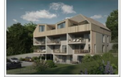
WOHNBAU I ADNET Übersicht Parken