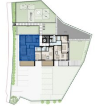
PARKPLATZ & ABSTELLRAUM