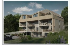
WOHNBAU | ADNET EG - TOP 2