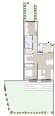
1 : 200