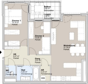
1. OBERGESCHOSS STRASSENBAUKÖRPER