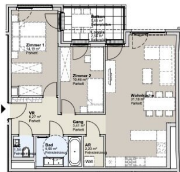
1. OBERGESCHOSS STRASSENBAUKÖRPER