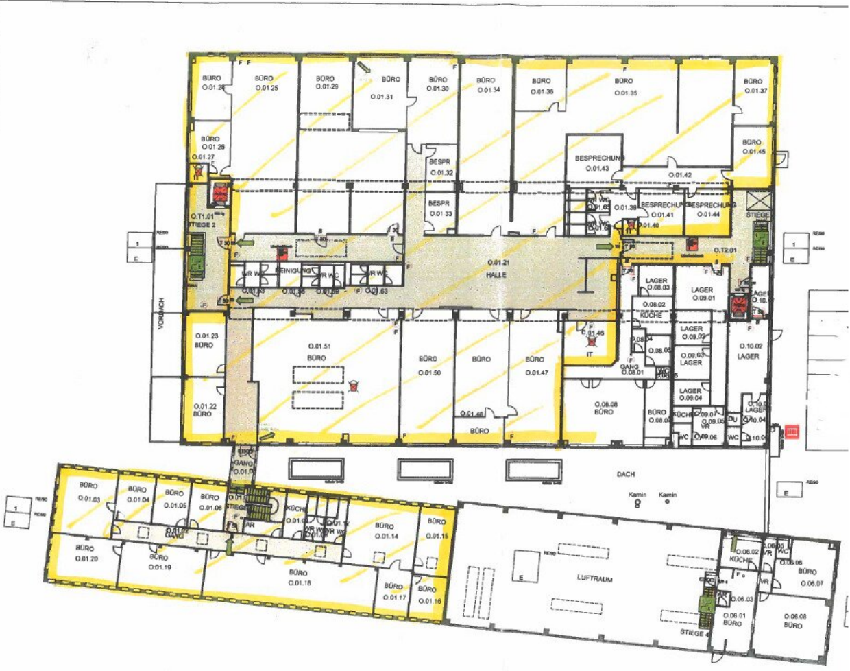
MASSSTAB - 1:250 0 2,5 5,0 10 15 25m