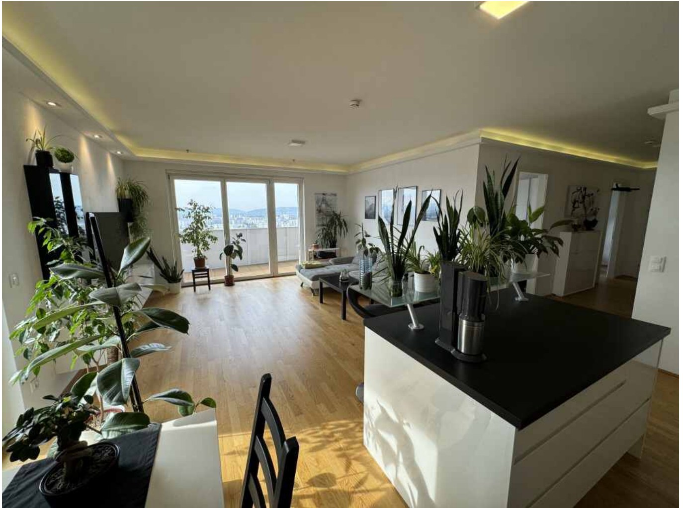
Blick ins Wohnzimmer

Objektnummer: 141/81337 Eine Immobilie von Rustler