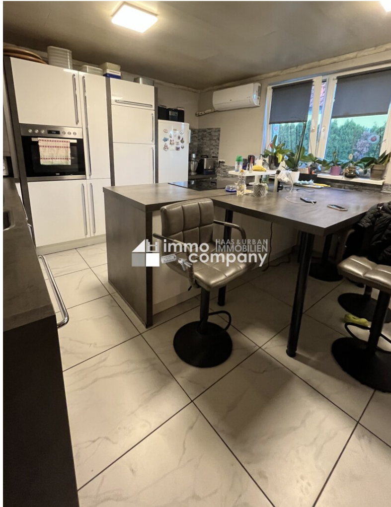
Küche - Einfamilienhaus Zillingdorf