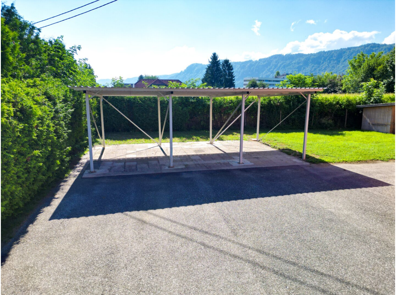
3x Einstellplätze Carport (Wohnmobil, Boot...)