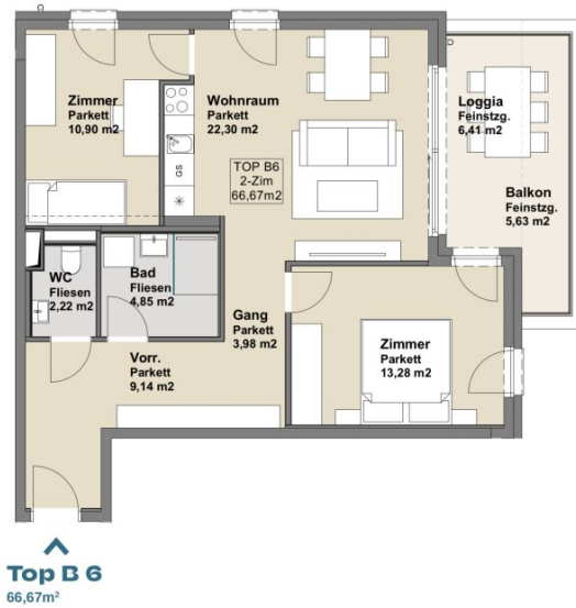
Top B 6 66,67m 2

Die in der Plandarstellung dargestellte Möblierung inkl. Küche ist schematisch und dient ausschließlich zur Illustration. Diese Darstellungen sind unverbindliche Plankopien. Der Planung und Ausführung sind Änderungen vorbehalten. Es gilt die Bau- und Ausstattungsbeschreibung. Die in den Plänen vorhandenen Abmessungen sind Planmaße und nicht für die Bestellung von Einbaumöbeln geeignet – es sind Naturmaße zu nehmen.