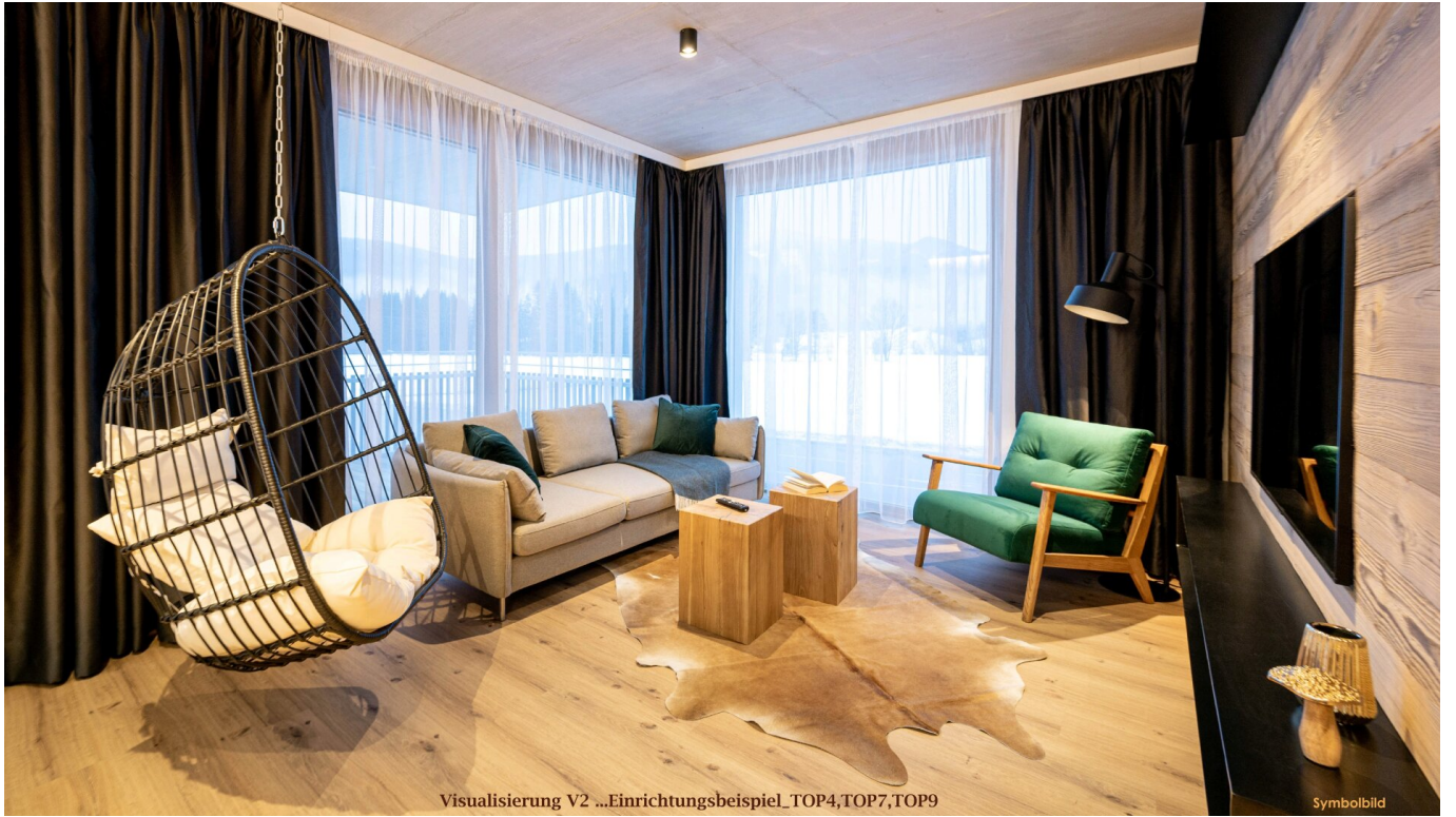
Visualisierung V2 ...Einrichtungsbeispiel_TOP4,TOP7,TOP9