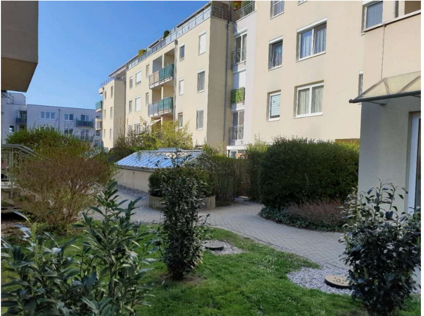
Kompagnon Immobilien Haus