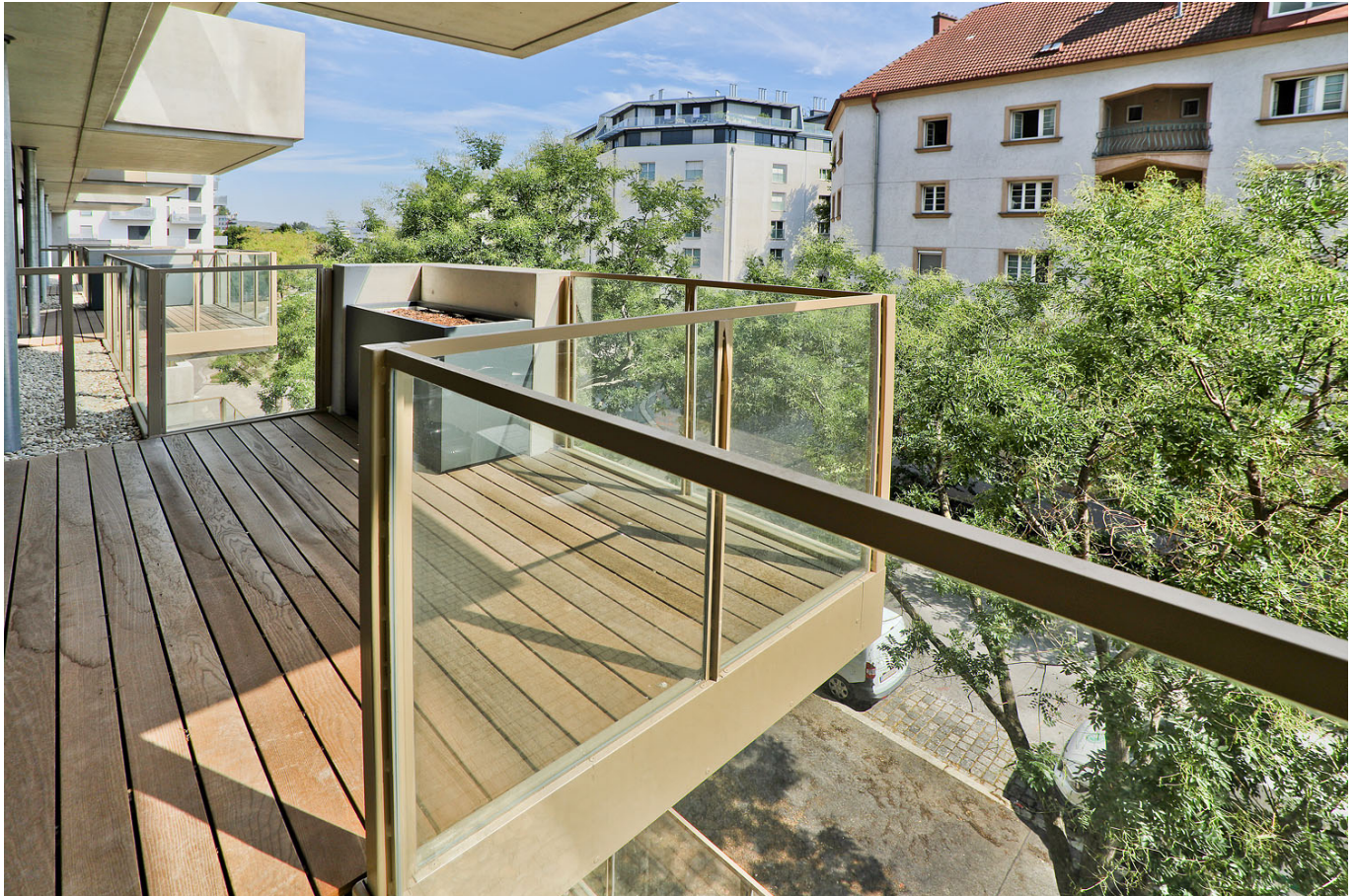
Balkon _2 Zi_3OG S

Objektnummer: 109245419 Eine Immobilie von ÖRAG Immobilien