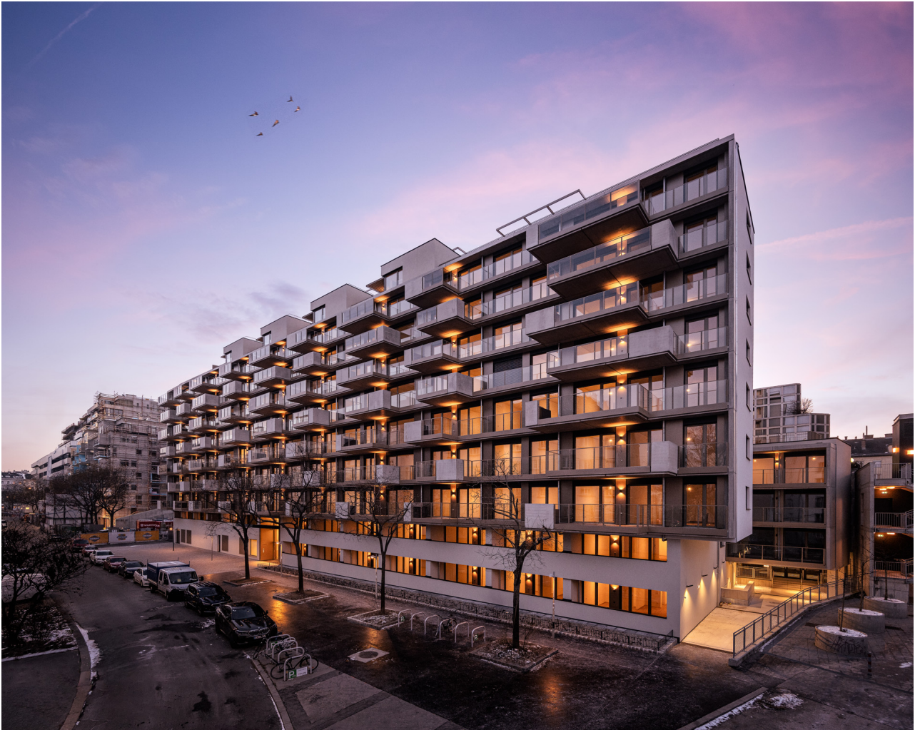
Sophie Außenansicht Abend