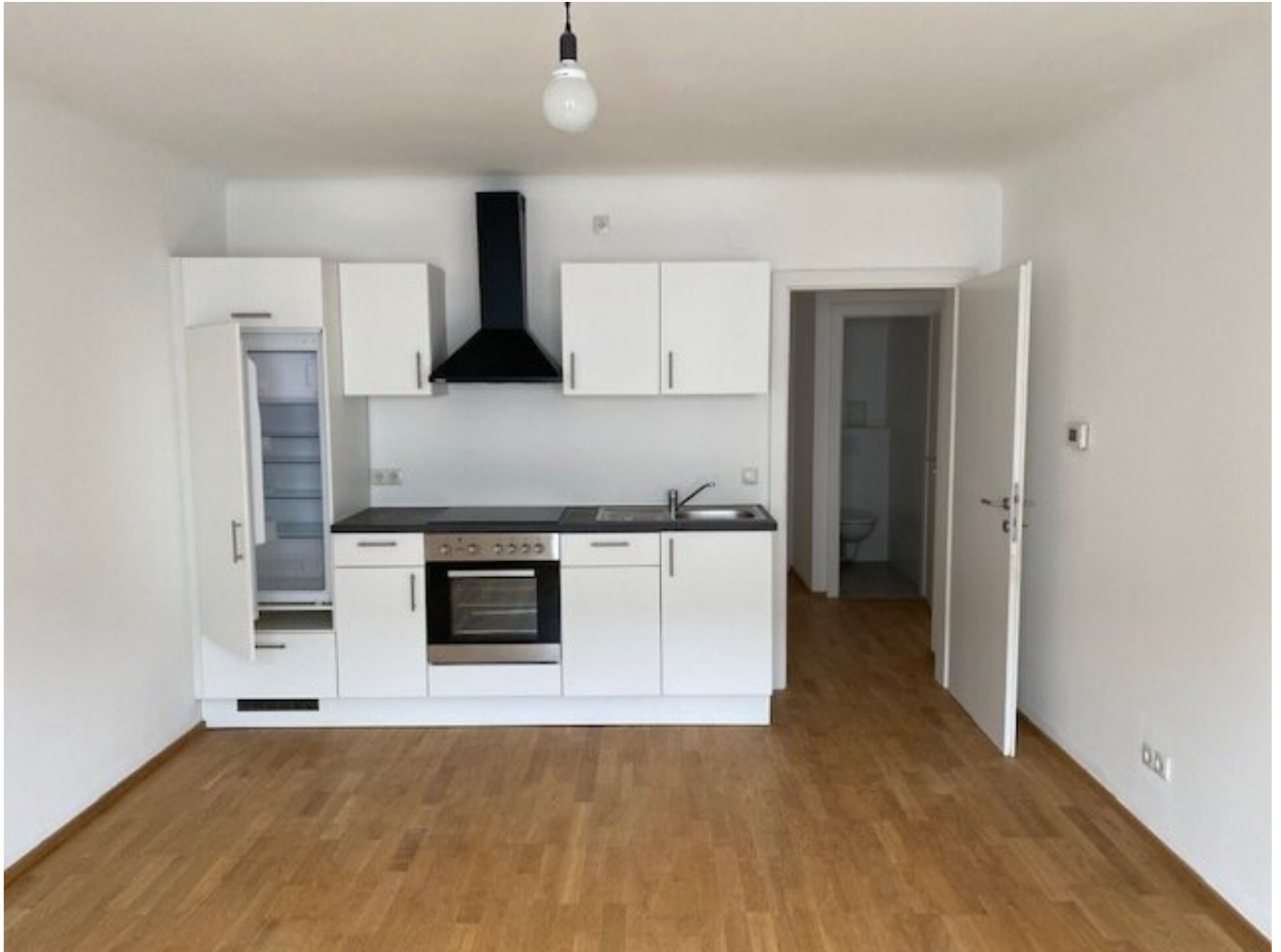
Einbauküche im Wohnzimmer