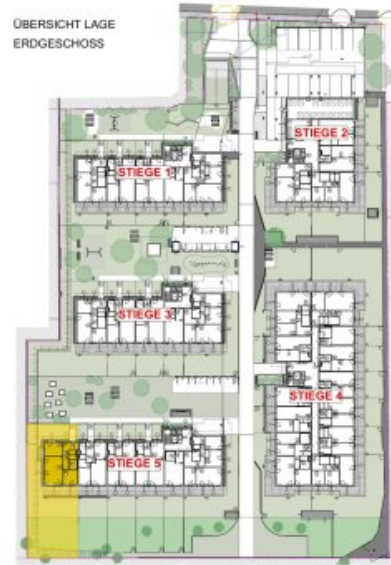
ÜBERSICHT LAGE ERDGESCHOSS

DIE ANGEgebenEN QUADRATMETERWERTE SIND CIRCA MAß. MAßTOLERANZEN BIS ZU 3% DER GESAMTFLÄCHE SIND MÖGLICH.