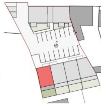
Übersicht EG | M 1:1000

RH 4A Erdgeschoss/ Obergeschoss | M 1:100 | A4