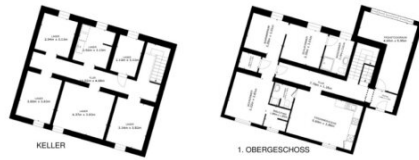
WOHNGEBÄUDE MIT GÄSTEZIMMERN