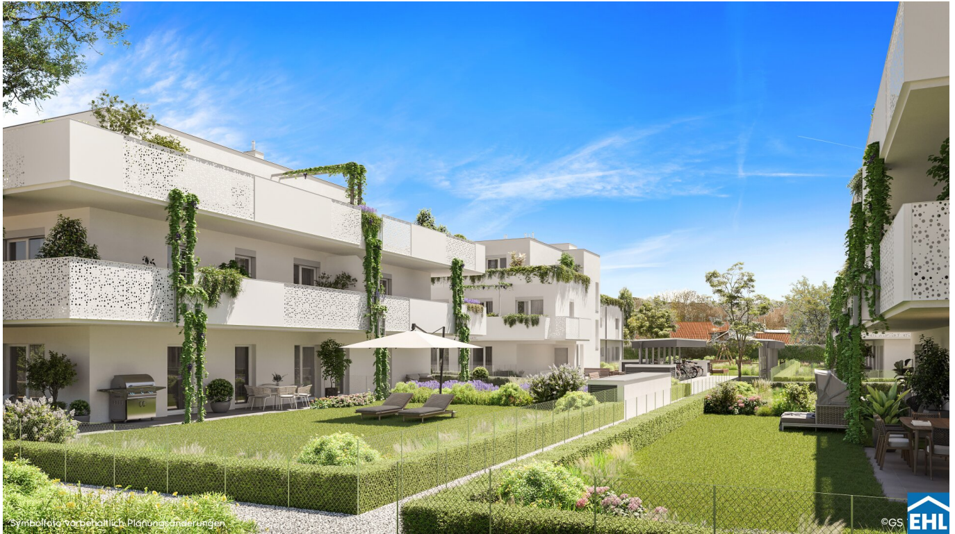
Symbolfoto, vorbehaltlich Planungsänderungen