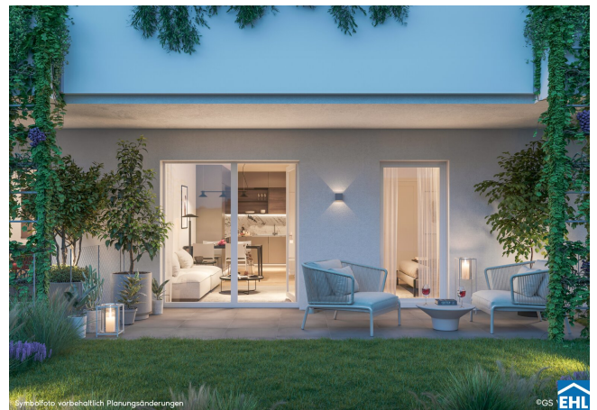
Symbolfoto, vorbehaltlich Planungsänderungen