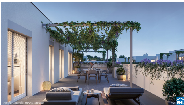
Symbolfoto, vorbehaltlich Planungsänderungen