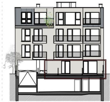
KLUGARGASSE 12 - 1230 WIEN