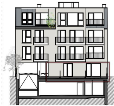
KLUGARGASSE 12 - 1230 WIEN