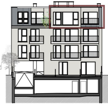
KLUGARGASSE 12 - 1230 WIEN