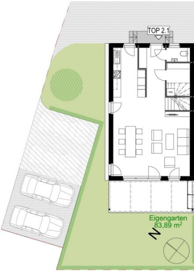
Obergeschoss TOP 2.1