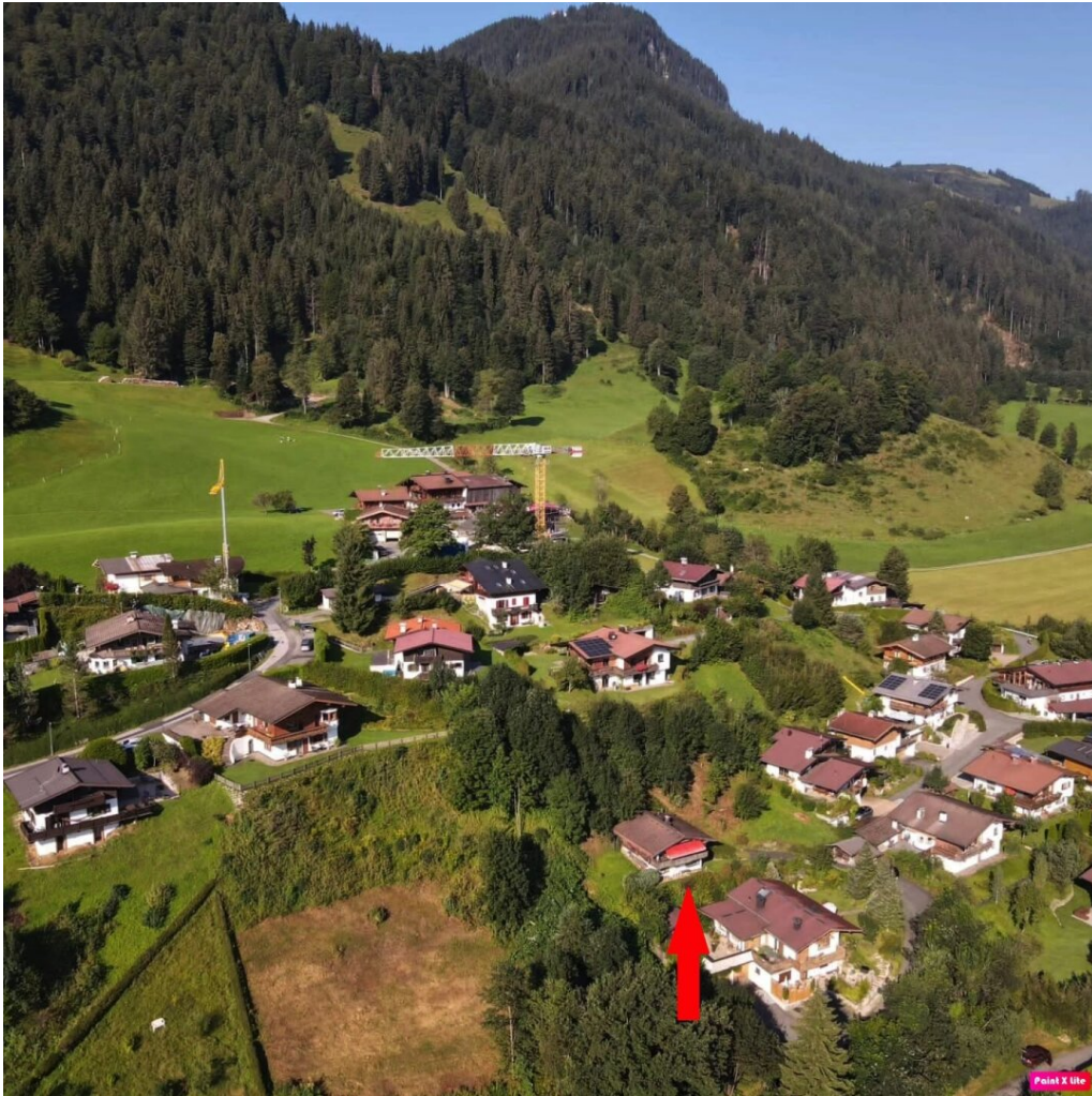
Immobilien in Kitzbühel