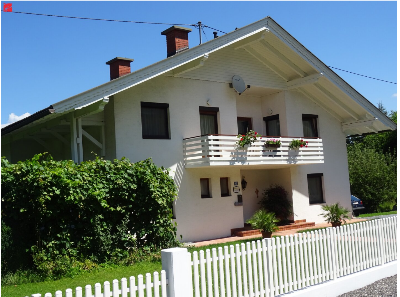
Reifnitz am Wörthersee