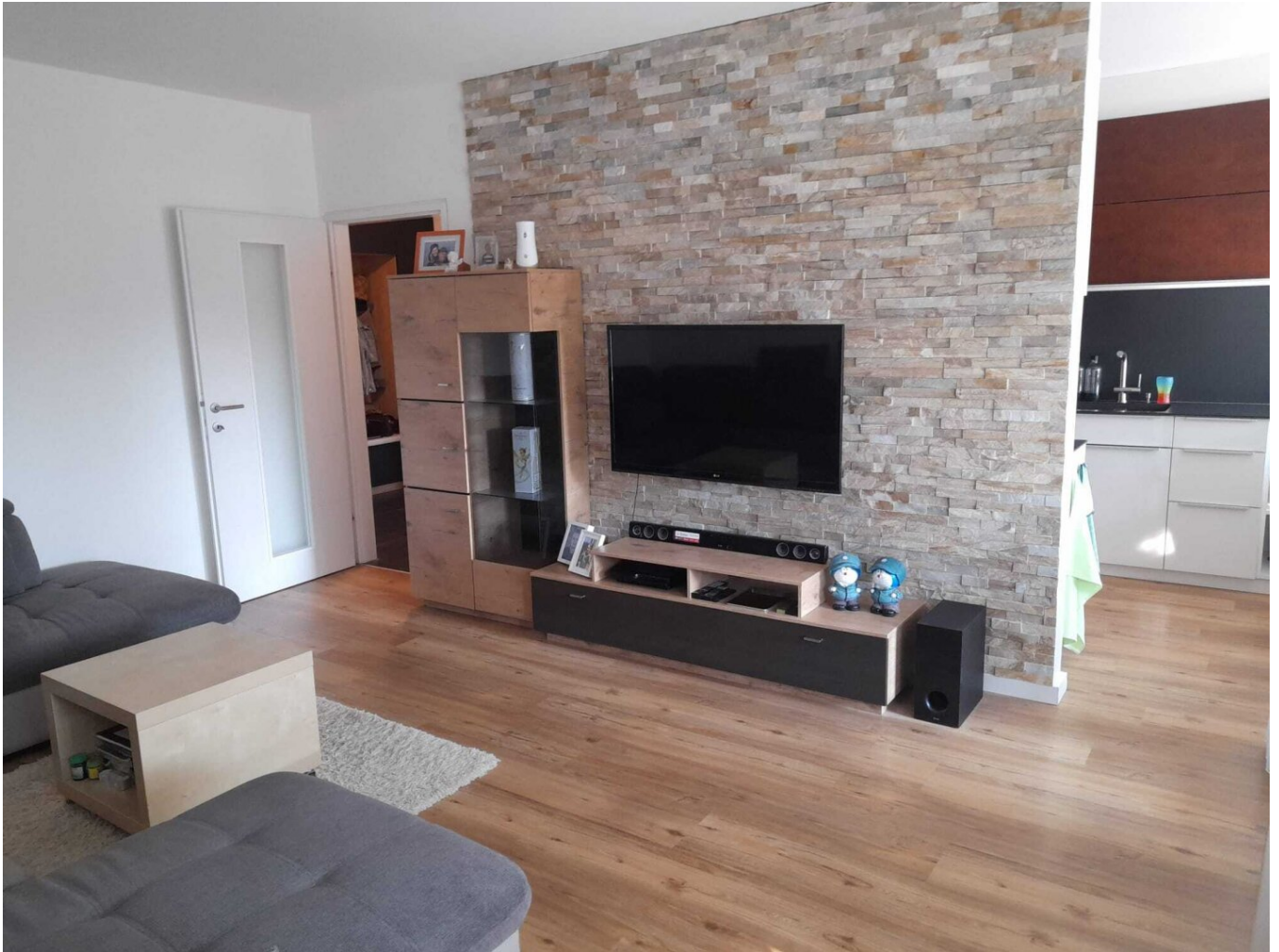
Kompagnon Immobilien Wohnzimmer