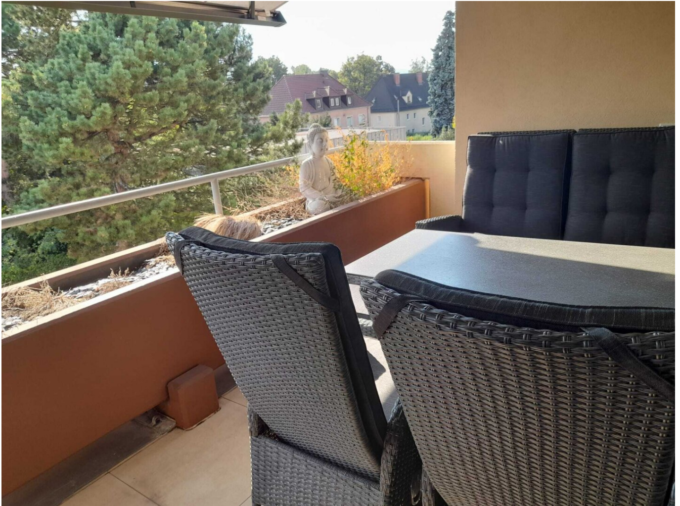
Kompagnon Immobilien Balkon