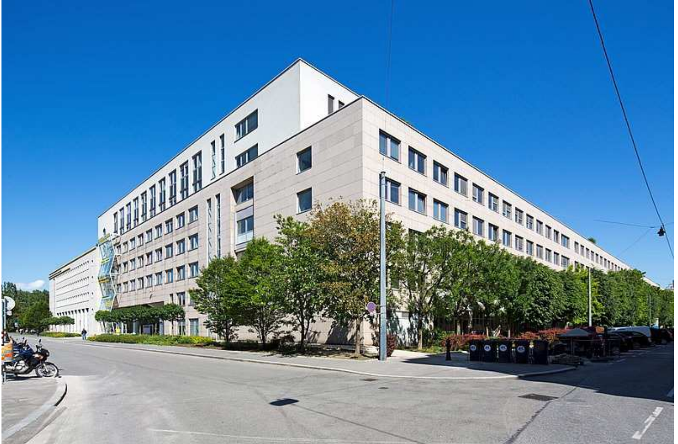
Außenansicht BT F