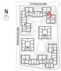
Lageplan ohne Maßstab