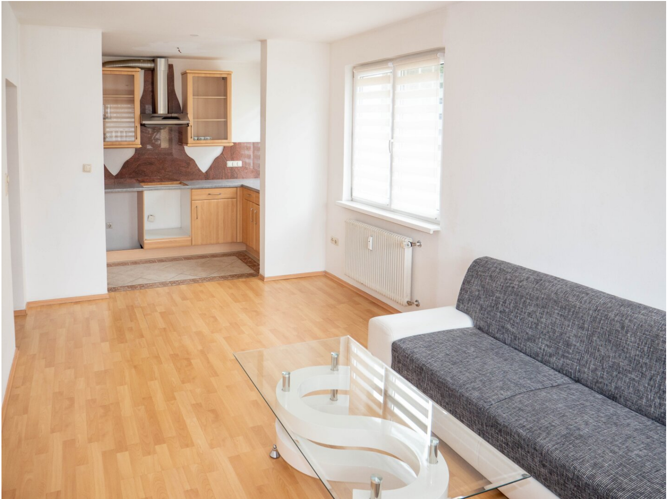
Wohnzimmer mit Küche