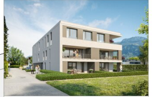
enderstraße 26, altach lageplan