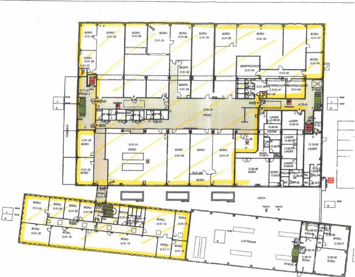
MASSSTAB - 1:250 0 2,5 5,0 10 15 25m