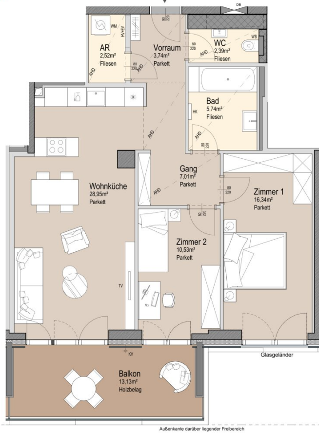
Außenkante darüber liegender Freibereich