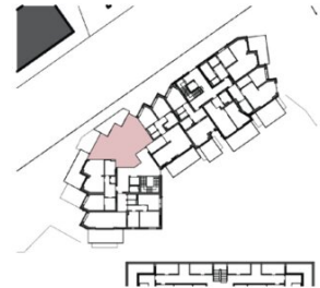
ÜBERSICHT (ohne Maßstab)