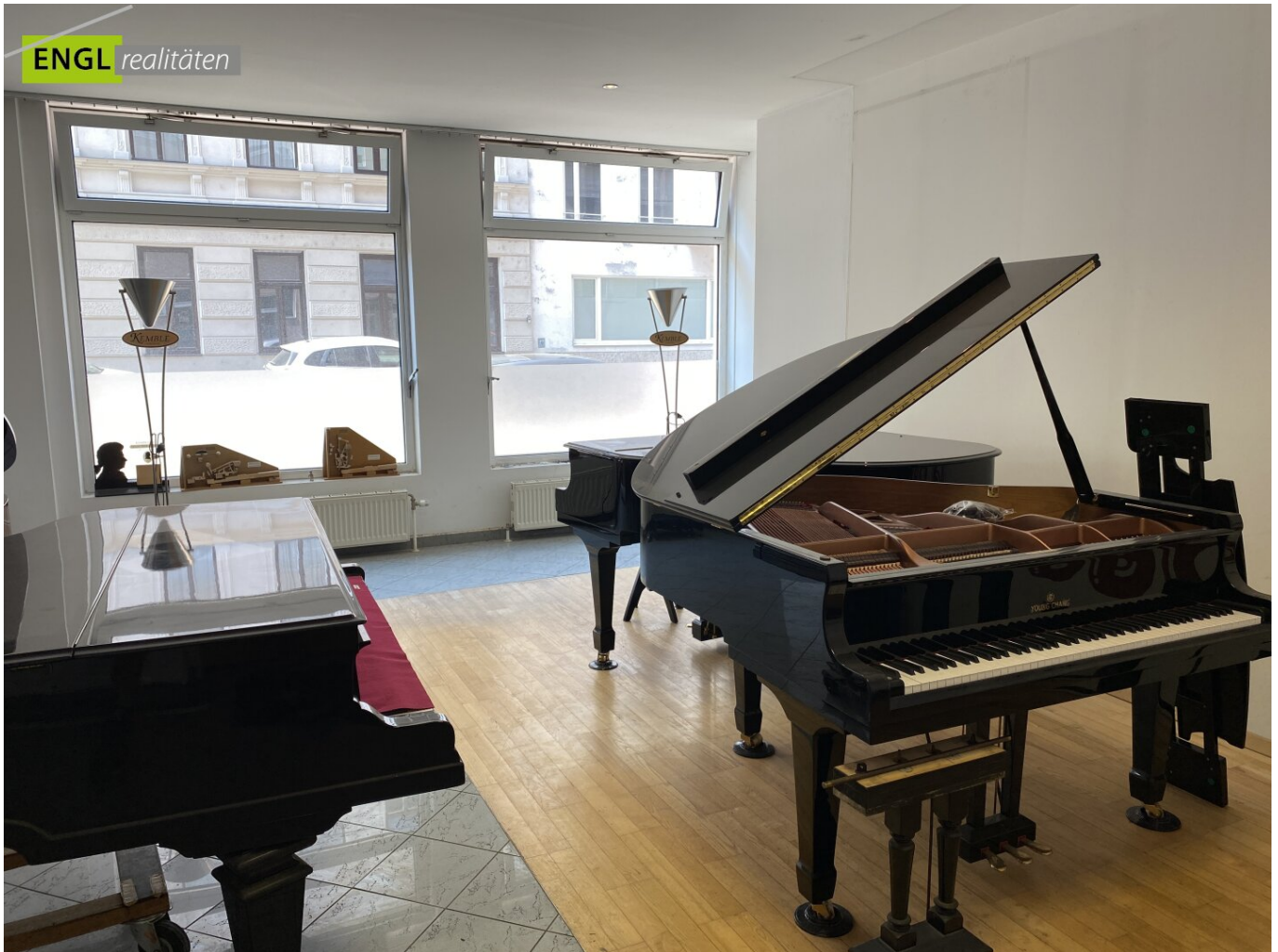
vorderer Schauraum , Eingangsbereich