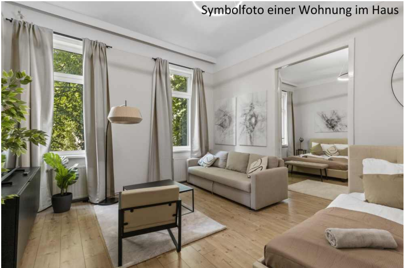
Symbolfoto einer Wohnung im Haus