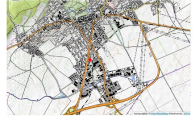
LAGE IM STADTGEBIET VON EISENSTADT

BAUMEISTER JOSEF PANIS Gesamtheit & CO KG PLANUNG BAULEITUNG 2700 Wiener Neustadt, Donaustr. 11, Tel.: 022221761, Fax: 022220943, e-mail: jk@panis.at