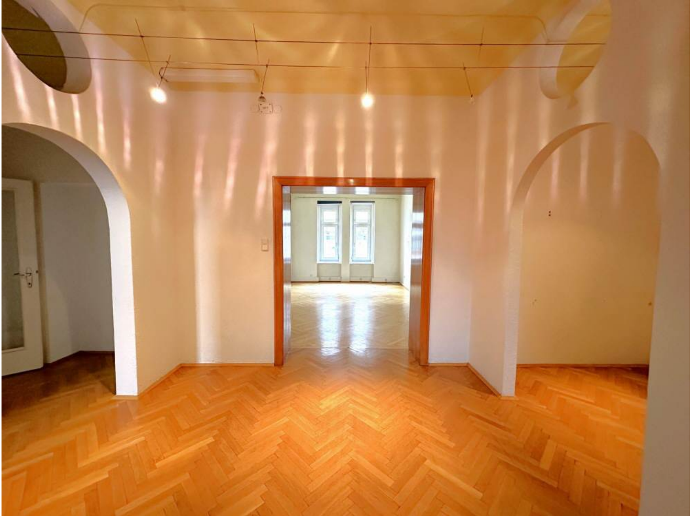
1.OG Vorraum (2)