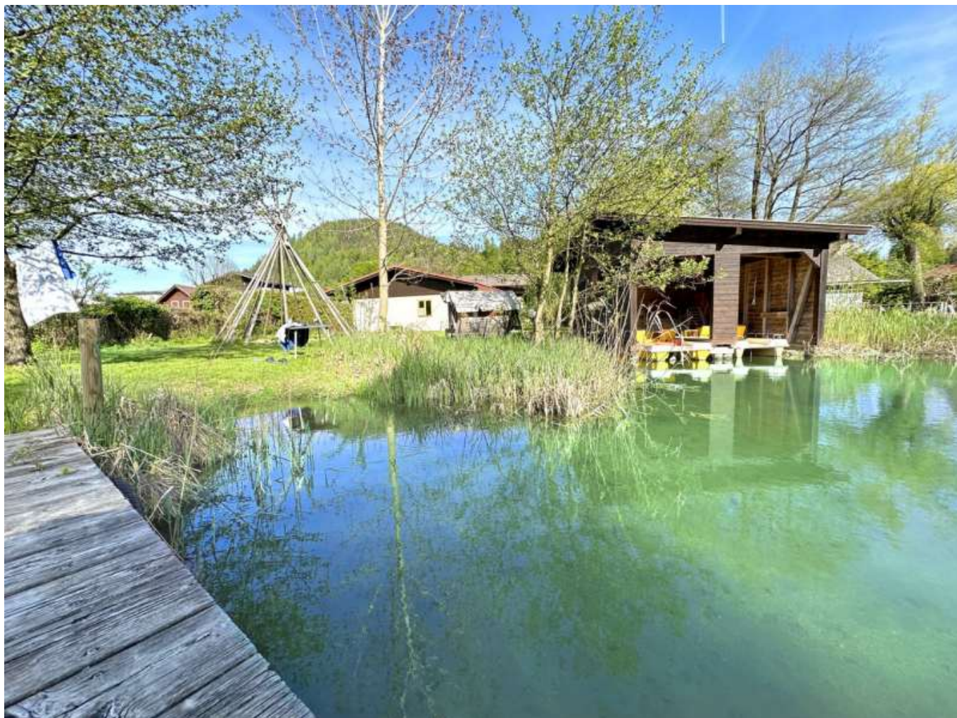
Steg Ufer BH