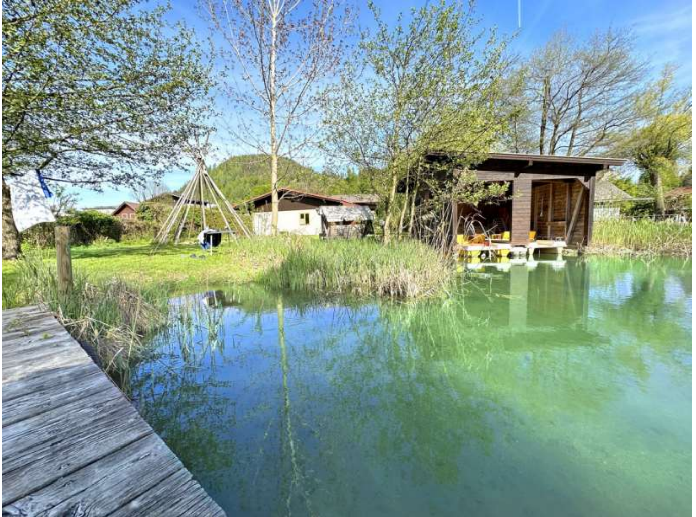
Steg Ufer BH

Objektnummer: 905/03375 Eine Immobilie von ATV Immobilien