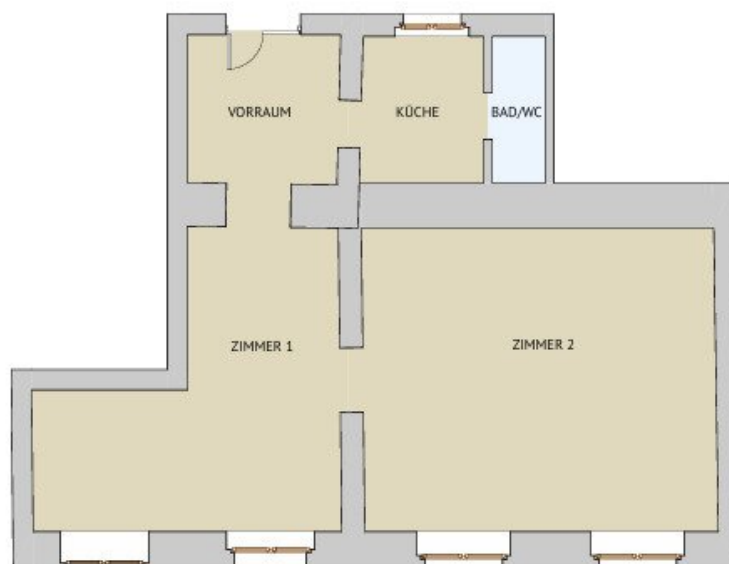
GRUNDRISS M 1:100