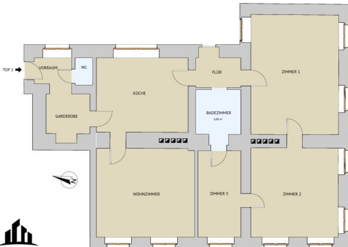
GRUNDRISS M 1:100