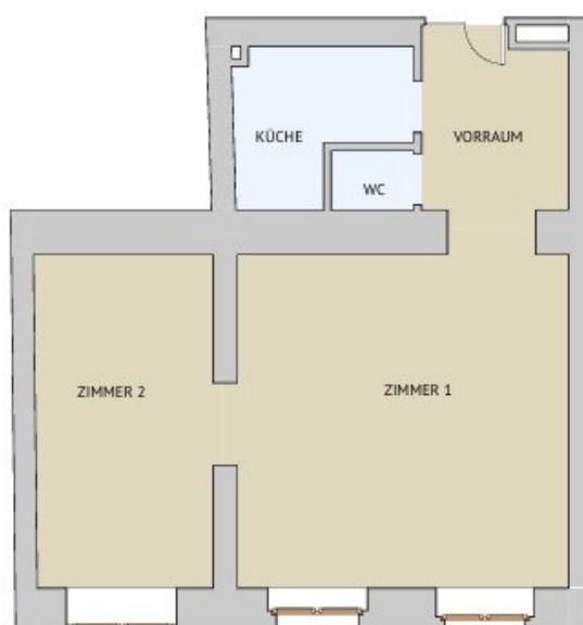
GRUNDRISS M 1:100