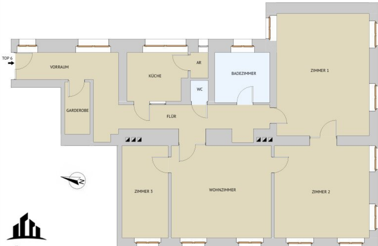
GRUNDRISS M 1:100