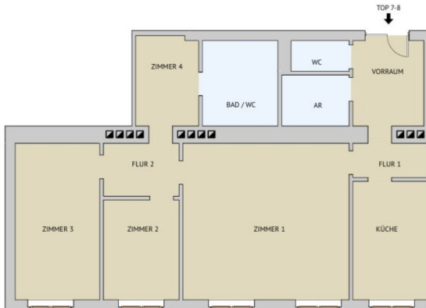
GRUNDRISS M 1:100