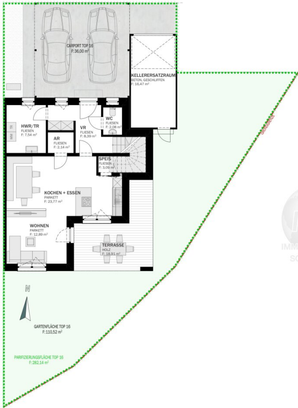
ERDGESCHOSS M 1:100