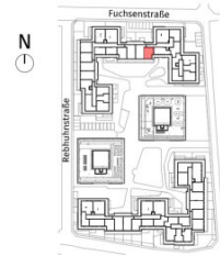
Lageplan ohne Maßstab