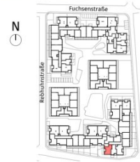
Lageplan ohne Maßstab