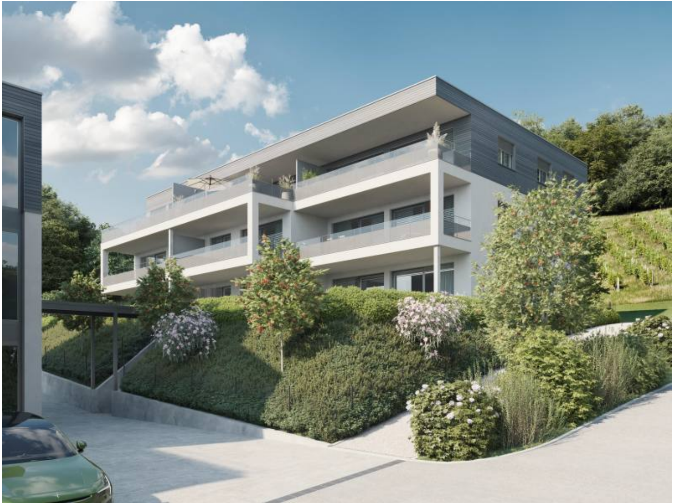
Ansicht Haus C