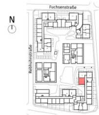
Lageplan ohne Maßstab