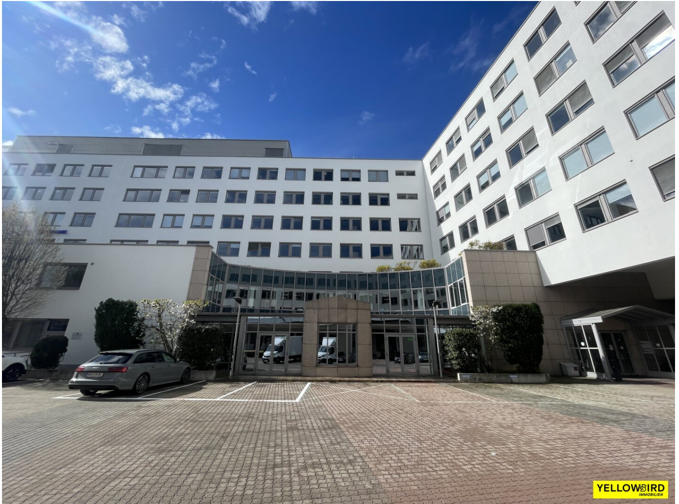
Außen - Innenhof

10 €/M 2 - 286 m 2 Büro - Großartige Infrastruktur - BK inkl. Heizung und Strom