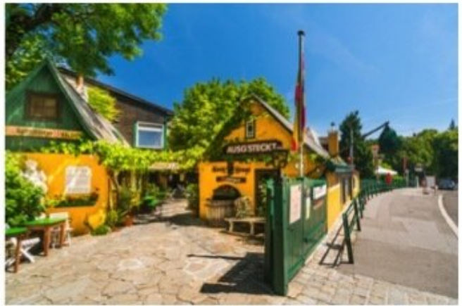
Der 19. Bezirk in Wien – Eine perfekte Mischung aus Kultur, Unterhaltung und Natur