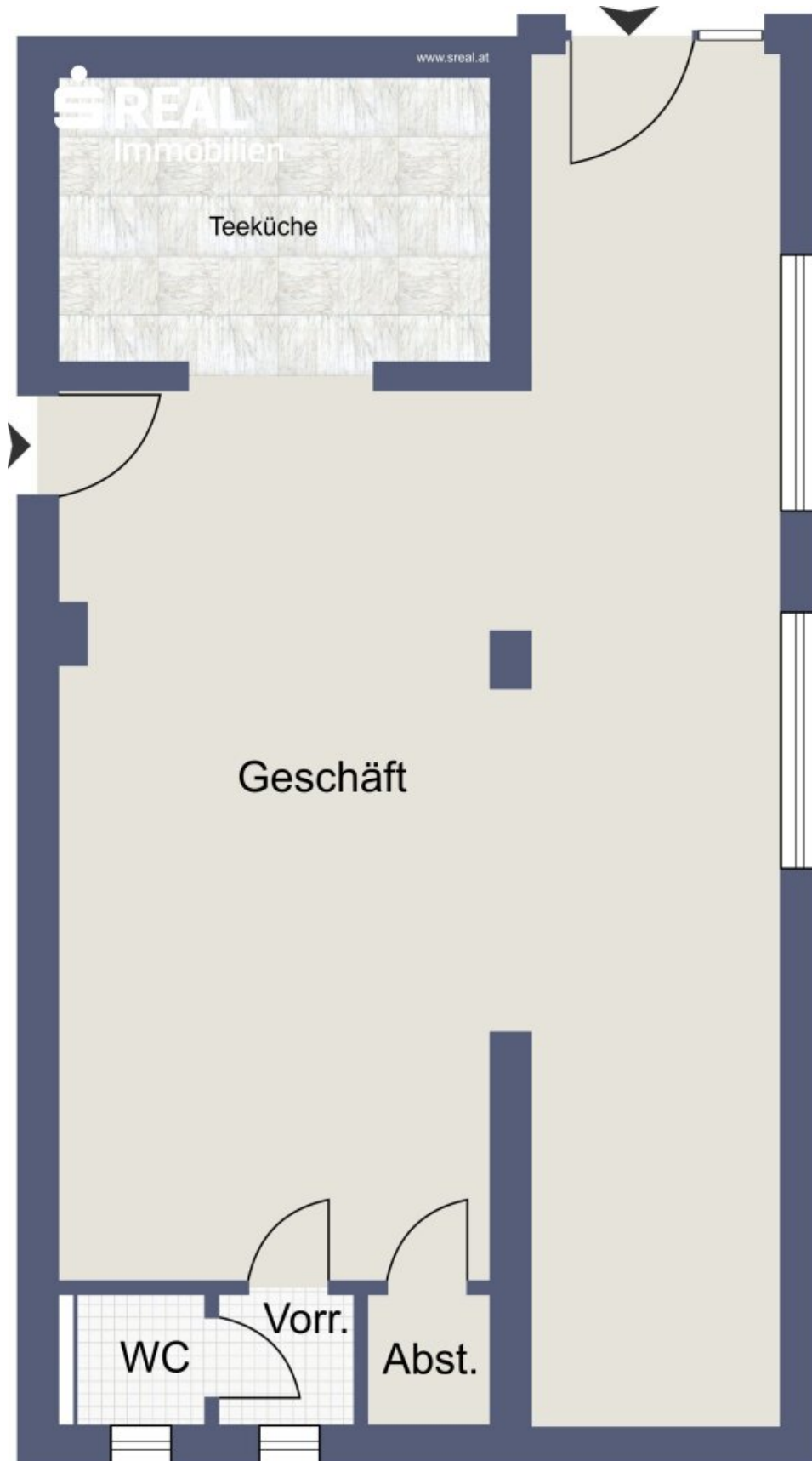
Skizze Top 1