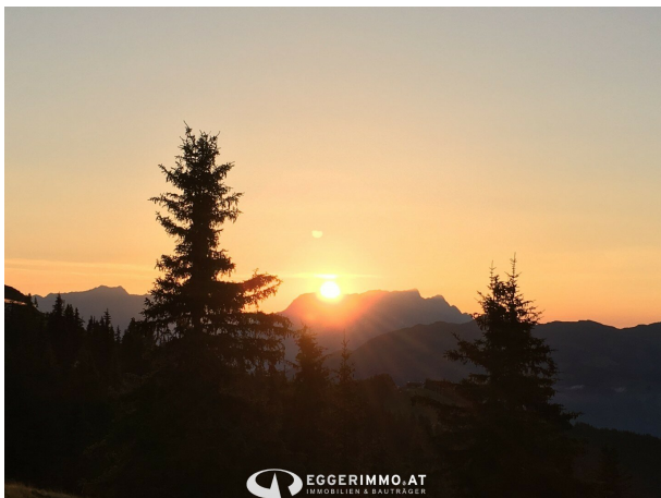
EGGERIMMO.AT IMMOBILIEN & BAUTRÄGER